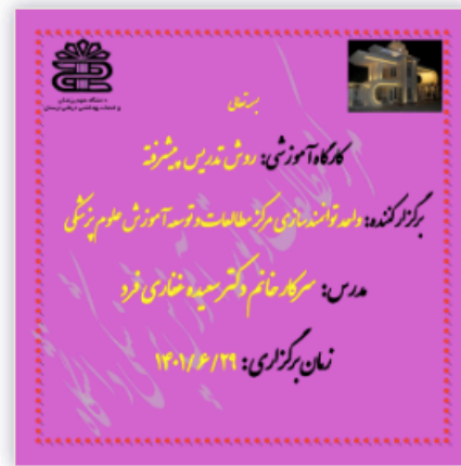
روش تدریس پیشرفته